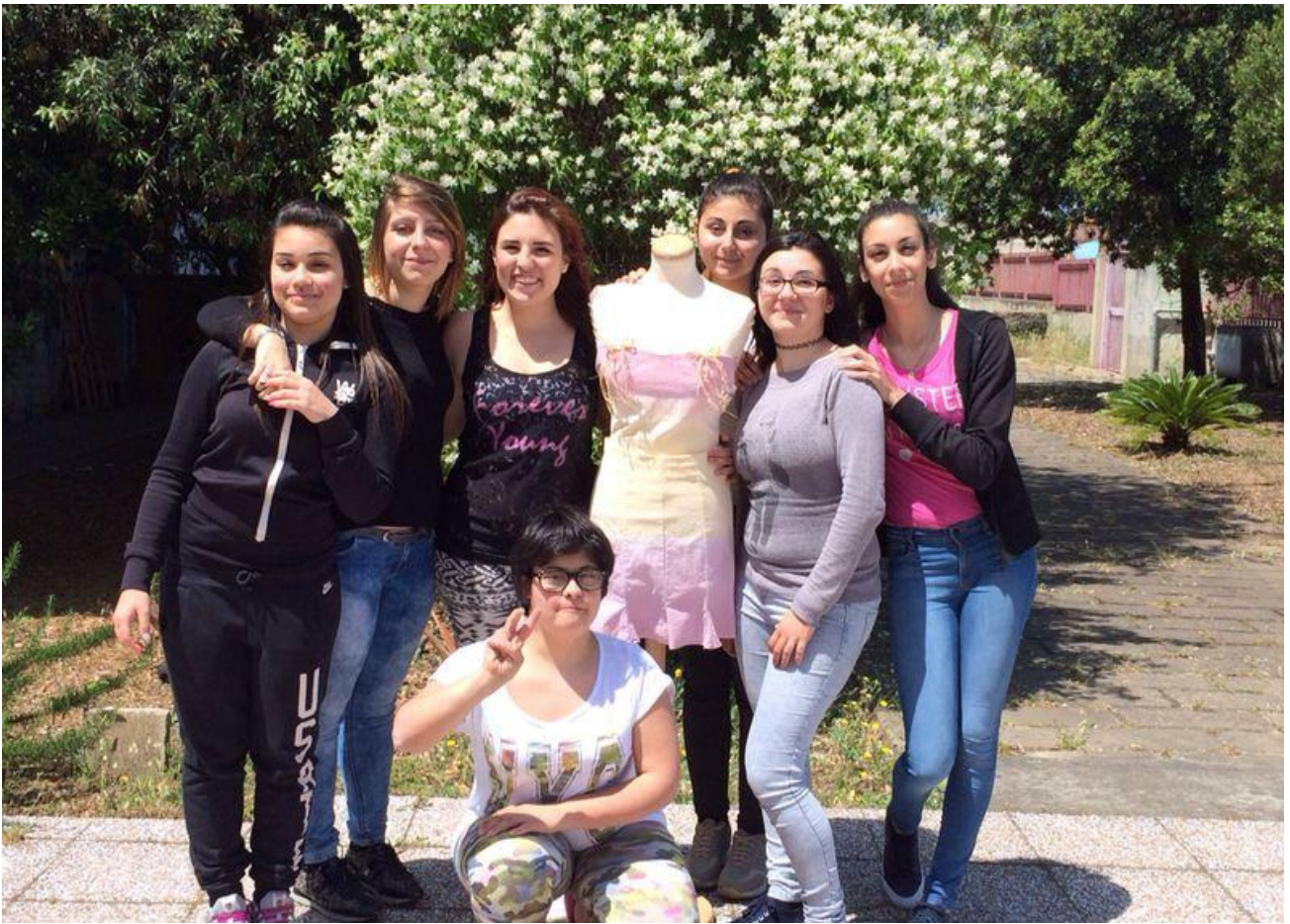
...Le autrici della "linea green"