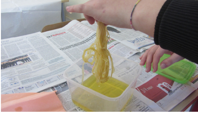
Tintura della rafia