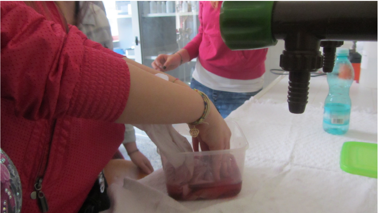
Tintura del capo d'abbigliamento