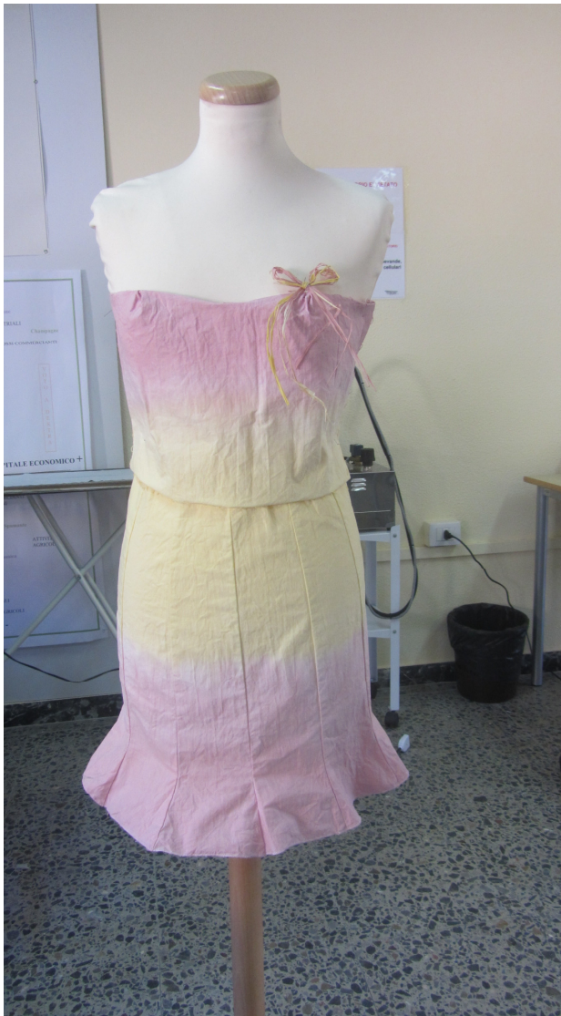
Messa in prova